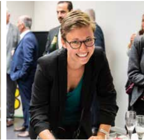
Lise MAGNIER Député de la Marne (4 ème circonscription)