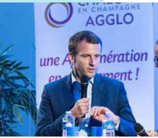
Emmanuel MACRON Président de la République