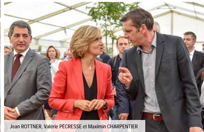
UNE PREMIÈRE EXCEPTIONNELLE L'organisation de la GRANDE TABLEE a permis de récolter 11 120€ au bénéfice de SOLAAL.