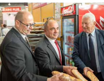
Dominique ANRACT Président de la confédération de la Boulangerie - Pâtisserie Française