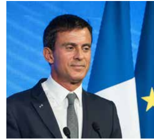
Manuel VALLS ancien Premier Ministre