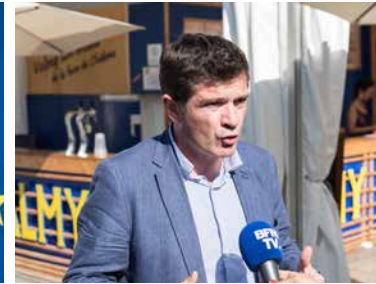
Benoist APPARU Maire de Châlons-en-Champagne