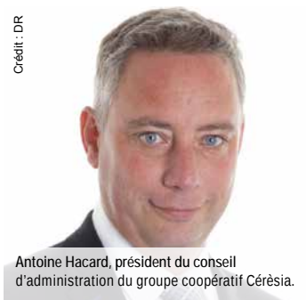
Antoine Hacard, président du conseil d'administration du groupe coopératif Cérésia.