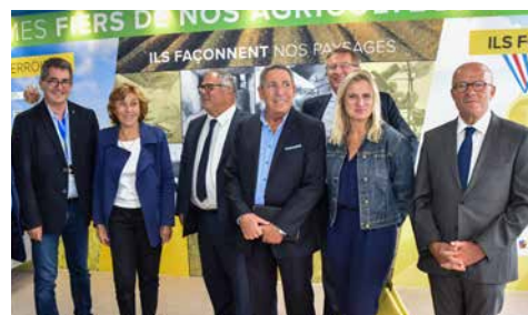
Edith CRESSON Ancienne Premier Ministre