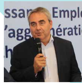
Xavier Bertrand Président de la Région Hauts-de-France