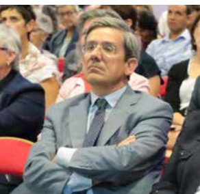
Charles de COURSON Député de la Marne (5 ème circonscription)