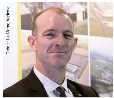
Credit: La Mame Agricole Pierre Bégoc : « Nous avons perdu plusieurs dizaines de milliers de tonnes de ressource à cause de la sécheresse estivale 2022 ».