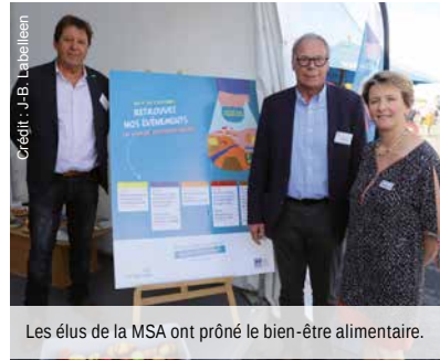
Les élus de la MSA ont prôné le bien-être alimentaire.

« De multiples actions vont avoir lieu sur le territoire avec une thématique commune : l'alimentation. Le but est de promouvoir nos actions, montre que la MSA accompagne les territoires et les agriculteurs dans bien des domaines. C'est précisément l'éducation à la santé et la volonté de faire évoluer les comportements par rapport à la nourriture qui anime ces futures animations. »