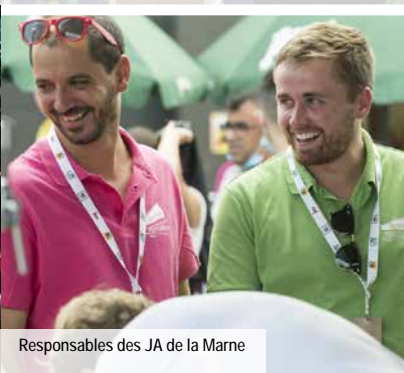
Responsables des JA de la Marne