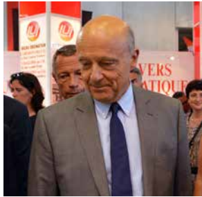
Alain JUPPÉ ancien Premier Ministre