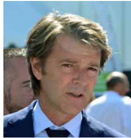
François BAROIN Maire de Troyes