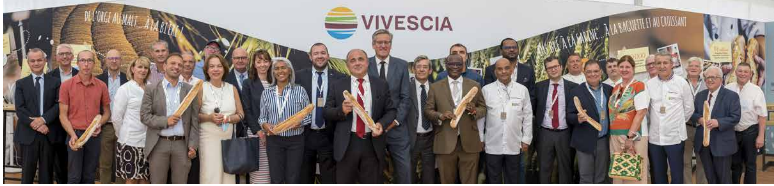
Délégation des Ambassadeurs de l'Unesco pour l'inscription de la baguette française au patrimoine mondial de l'Unesco accompagné d'Associés-coopérateur de la coopérative et des instances dirigeantes du Groupe Vivescia.