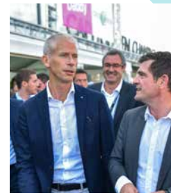
Franck RIESTER Ministre délégué chargé des relations avec le Parlement