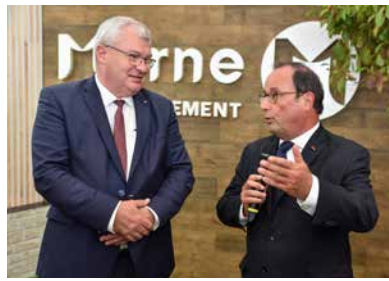
François HOLLANDE ancien Président de la République