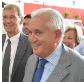
Jean-Pierre RAFFARIN ancien Premier Ministre