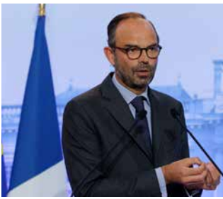
Édouard PHILIPPE Ancien Premier Ministre