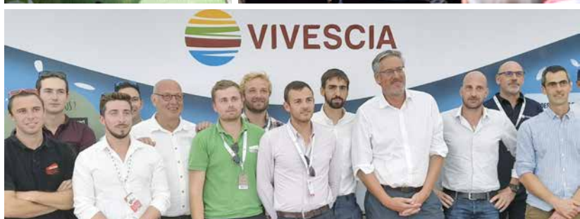
Lors d'une rencontre avec Vivescia, la coopérative a proposé de créer une structure consultative, composé de jeunes agriculteurs, afin de proposer des idées neuves à son conseil d'administration.