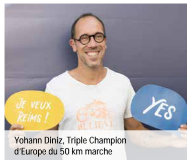
Yohann Diniz, Triple Champion d'Europe du 50 km marche