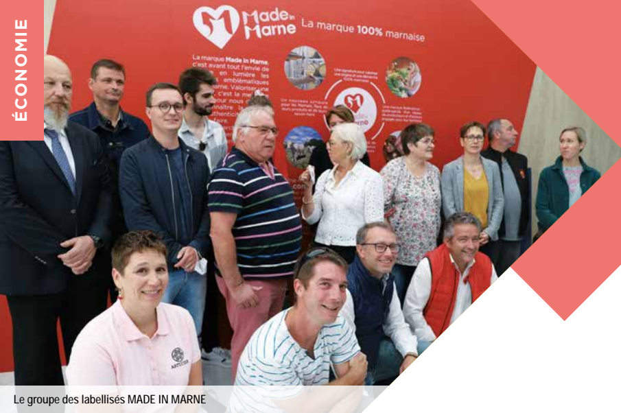
Le groupe des labellisés MADE IN MARNE