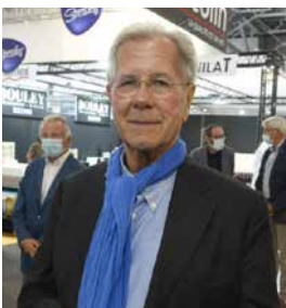
Jean-Louis Debré Ex-Président du Conseil Constitutionnel