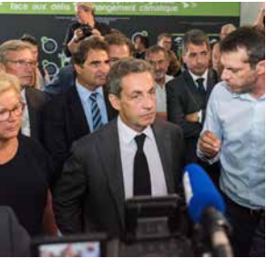
Nicolas SARKOZY ancien Président de la République