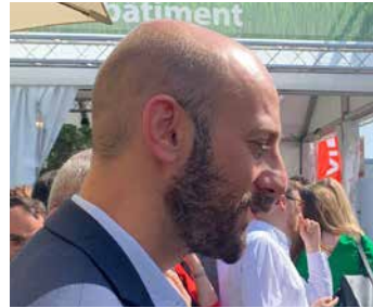
Stanislas GUERINI Directeur Général de la République en Marche