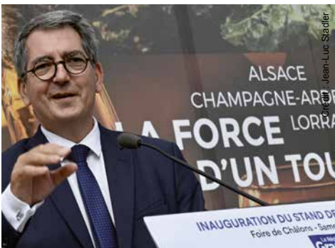
Pour Jean Rottner c'est « pari tenu pour la fibre ».